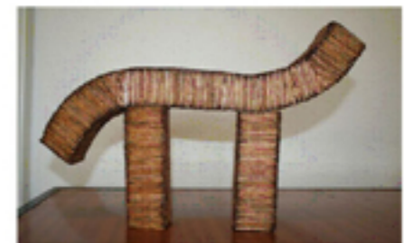
\pi vencedor com o 1.º lugar