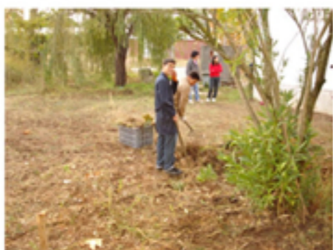
Preparação da parcela de terreno a intervir