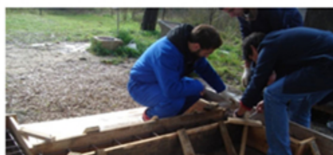
Elaboração da cofragem para as fundações da obra