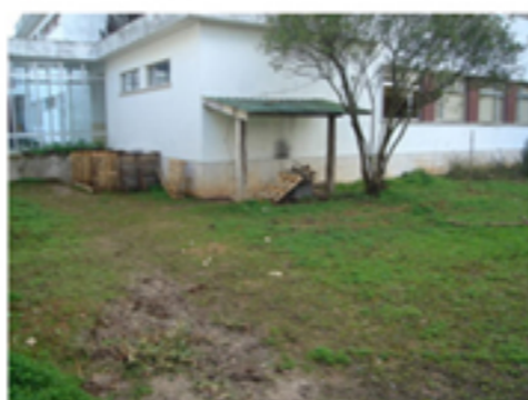
Parcela de terreno a intervir