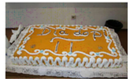
bolo comemorativo do dia do \pi

Os trabalhos foram expostos na sala 11 do pólo II onde também foram colocadas algumas curiosidades Matemáticas, bem como jogos de Engenho.