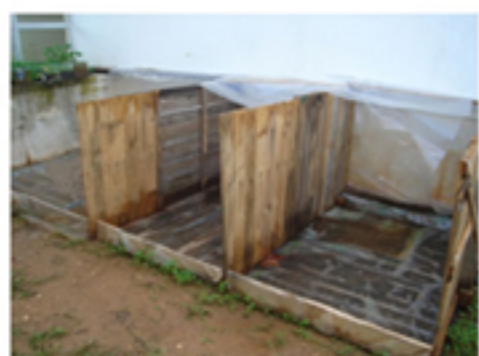
Construção da estrela de inertes