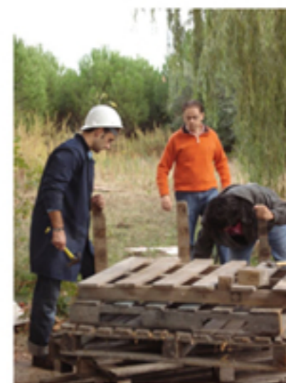
Preparação da madeira para reutilização