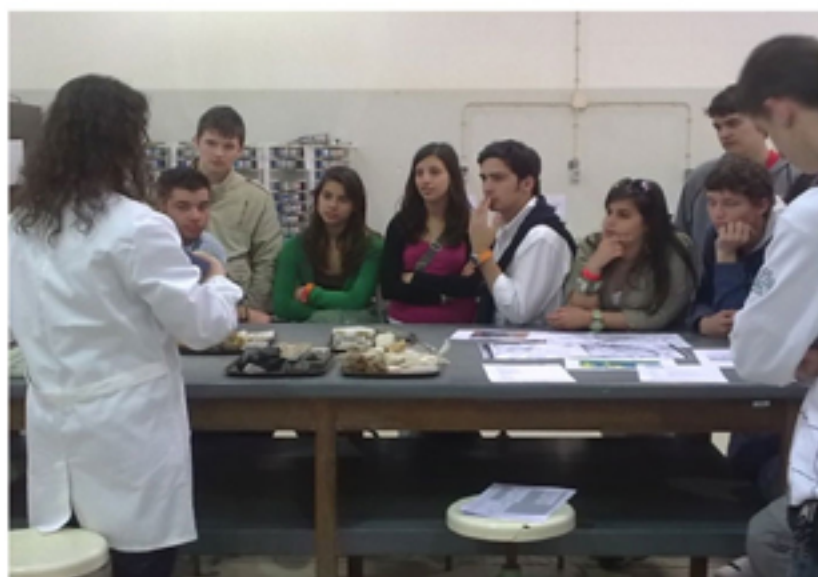
Classificação macroscópica de Rochas e Minerais

Constatou-se que os conhecimentos que os alunos vêm aprendendo ao longo do seu plano curricular são essenciais para a concretização da prática da construção uma vez que o conhecimento das características físicas e químicas dos materiais é indispensável para assegurar uma melhor eficiência na construção civil. O ambiente que ali se vive, muito próprio do ensino superior, motivou alguns alunos no sentido de continuarem os seus estudos.