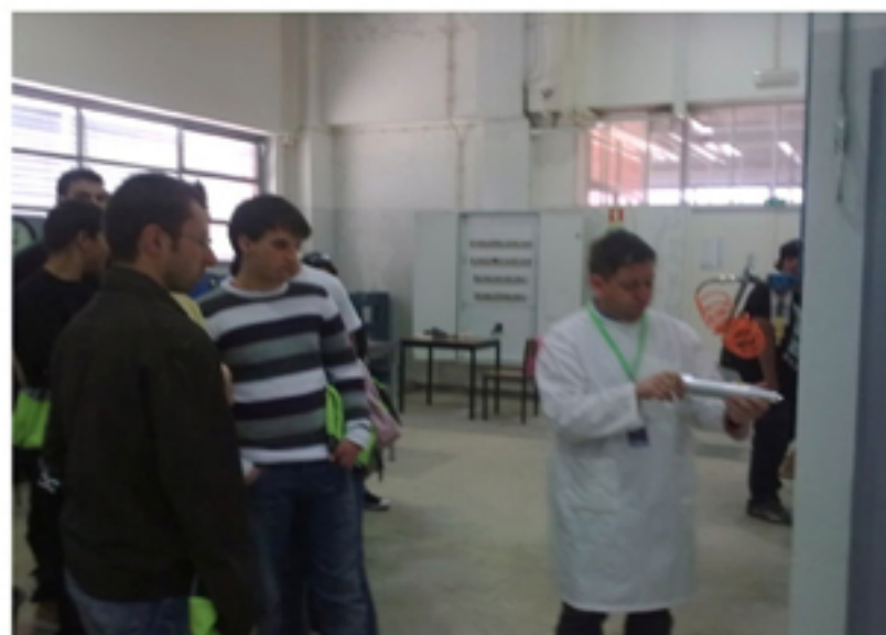
Ensaio a um elemento estrutural